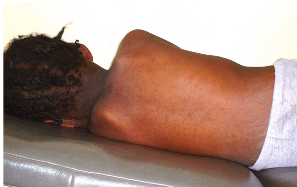
Enfant avec des éruptions cutanées, possible signe d'une rubéole aiguë

Une infection chez la femme enceinte non immunisée peut causer de graves dégâts pour le fœtus.